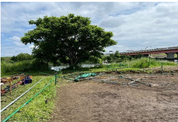
バックネット裏施設類撤去