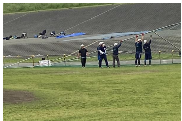
外周パイプ撤去・転倒

※許可工作物の状態が分かるように撮影してください。 ※異常等があった場合については、その状態が分かる写真を撮影し、写真の説明を記載してください。