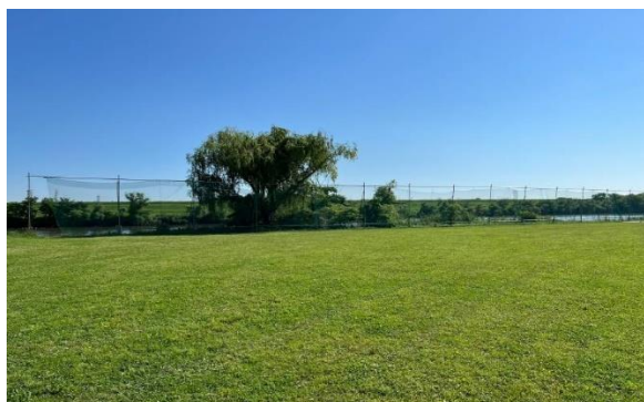
センターからライト奥ブルペン（撤去前）