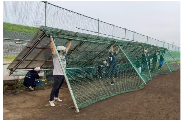
ベンチ撤去・転倒