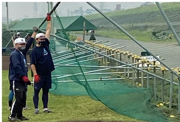
パイプ・ネット類撤去・転倒