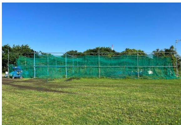
バッティングゲージ施設（撤去前）