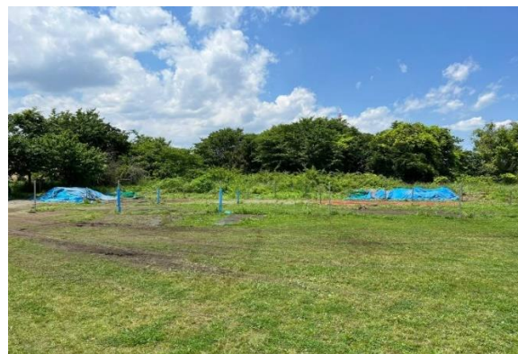
バッティングゲージ施設（撤去後）