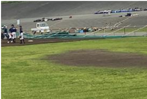
バックネット撤去