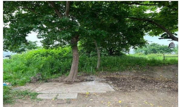
移動式施設 (撤去後)