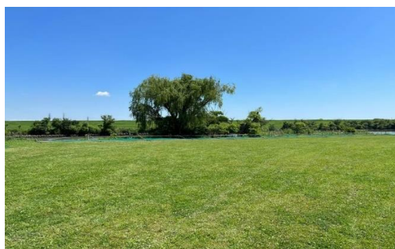
センターからライト奥ブルペン（撤去後）