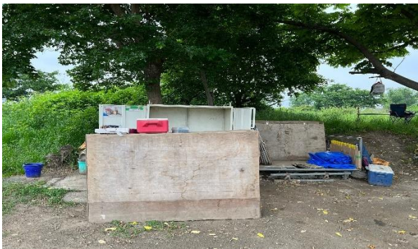
移動式施設 (撤去前)